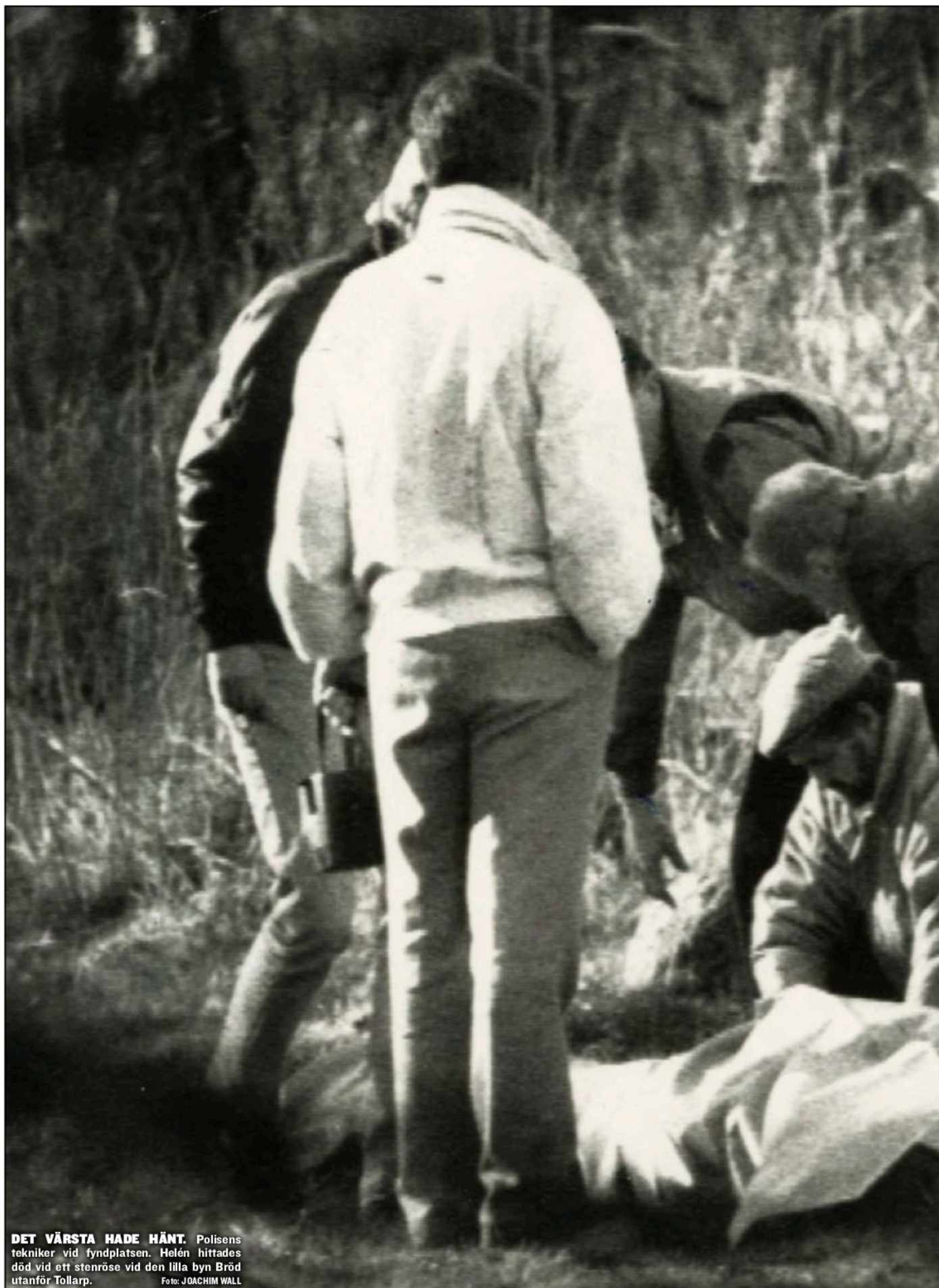
DET VÄRSTA HADE HÄNT. Polisens tekniker vid fyndplatsen. Helén hittades död vid ett stenröse vid den lilla byn Bröd utanför Tollarp.