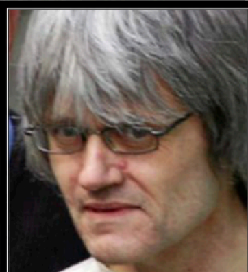
Ulf Olsson tog sitt liv den 10 januari 2010.