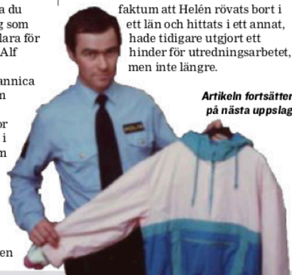
Artikeln fortsätter på nästa uppslag

Jag skäms, det jag har gjort är oförlåtligt